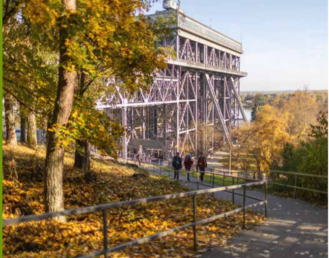
Das alte Schiffshebewerk Niederfinow

Aus der Altstadt Oderbergs mit dem Binnenschiffahrts-Museum geht es durch sanft hügeliges Wald- und Offenland leichten Fußes nach Liepe mit seinen interessanten Ziegelbauten, bevor sich plötzlich zwei gigantische Bauwerke auftun. Das alte Schiffshebewerk Niederfinow ist ein technisches Meisterwerk – bei der Fertigstellung 1934 war es das weltgrößte Hebewerk und macht bis heute die 36 Meter Höhenunterschied zwischen Kanalende und Niederoderbruch schiffbar. Mit dem Bau des neuen Schiffshebwerks Niederfinow Nord wurde die Zukunft des Bindeglieds zwischen Oder, Havel und Elbe gesichert, um noch größere Schiffe in Minutenschnelle zu heben. Die wasser- und geschichtsträchtige Tagesetappe klingt gemütlich entlang des Finowkanals aus.