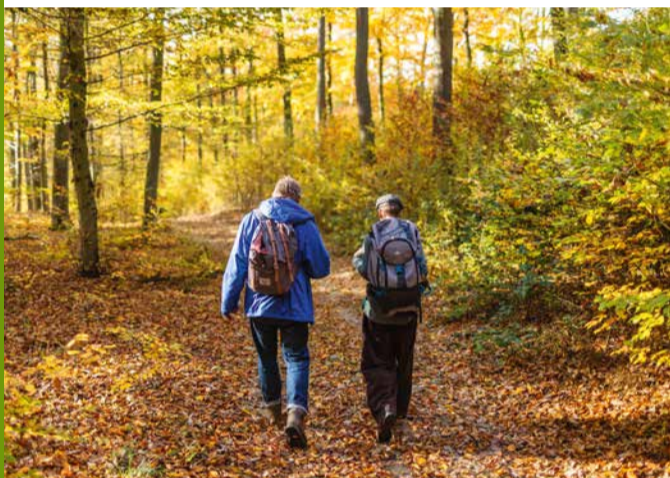
Durch das UNESCO-Weltnaturerbe Buchenwald Grumsin

Noch bevor man Joachimsthal verlässt, wartet die BIORAMA Aussichtsplattform, welche einen einzigartigen 360 Grad Panoramablick ermöglicht. Am historischen Kaiserbahnhof vorbei, grüßt man kurz den Werbellinsee. Der nächste Abschnitt führt entlang der Trasse der Schorfheide-Bahn bis nach Althüttendorf. Anschließend geht es weiter nach Groß-Ziethen, über eine Schleife durch das UNESCO Weltnaturerbe Buchenwald Grumsin. Im Geoparkzentrum in Groß-Ziethen entführt ein nachgebildeter Gletschertunnel in die Eiszeit vor etwa 15.000 Jahren. Die Zeitreise endet im Heute. Nach abwechslungsreichen Landschaftszügen gelangt man über Senftenhütte nach Chorin.