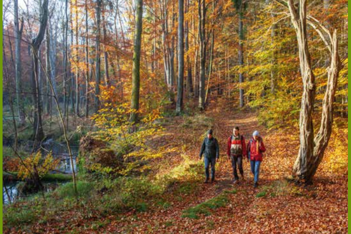
Blick auf den Werbellinsee

Über einen toll gelegenen Naturpfad wandert man entlang des Werbellinkanals, an dessen Ende sich die Brücke am Askanierturm wie ein Tor zum Werbellinsee auftut. Ein letztes Mal trifft der Wanderpfad auf den Werbellinsee, bevor man auf einem langen Waldstück mitten durch die Natur der grünen Schorfheide geführt wird. Der Weg verläuft entlang des Gedenksteinwegs am ehemaligen Jagdschloss Hubertusstock und vorbei am Alteichenpfad, wo sich ein Abstecher zu den Baumältesten der Schorfheide lohnt. Anschließend tritt man durch Wald- und Offenland den letzten Abschnitt nach Joachimsthal an, wo man im historischen Stadtkern oder gar mit Blick auf den Grimnitzsee nächtigen kann. Von Mai bis Oktober kann der Etappenteil Werbellinsee auch mit dem Dampfer absolviert werden ( www.reederei-wiedenhoef.de ).