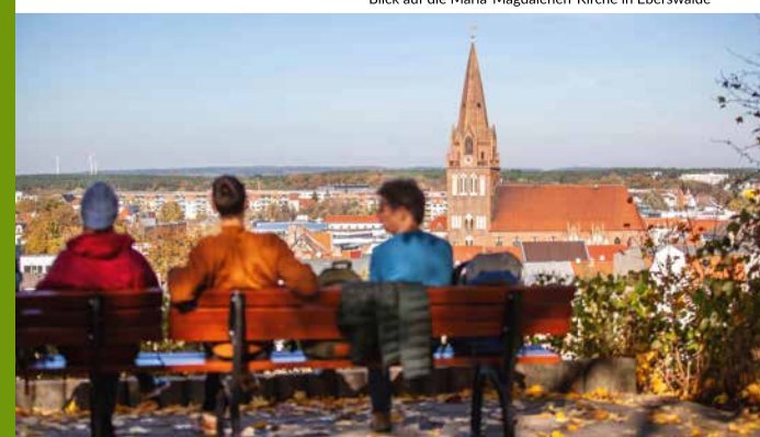
Blick auf die Maria-Magdalenen-Kirche in Eberswalde

In Niederfinow startet man am Bahnhof, links in Sichtweite die alte Zugbrücke über den historischen Finowkanal, wo früher Kähne mit Muskelkraft und echter Pferdestärke „getreidelt“ wurden. Die Tour führt über Karlswerk an Hohenfinow vorbei, ein Abstecher in den Dorfkern hinein, zur Straußenfarm mit Hofladen und zum Aussichtspunkt am Liebenstein ist auf jeden Fall sehr empfehlenswert. Auf den letzten Kilometern durch die grünen Wälder des Naturparks Barnim, lässt man die gemeisterten Etappen und 135 Kilometer Revue passieren und erreicht glücklich die Stadtgrenzen von Eberswalde. Der Wanderweg führt direkt an der Hochschule für Nachhaltige Entwicklung Eberswalde vorbei, wo sich ein kurzer Abstecher zur Stadtpromenade am alten Finowkanal oder zum Aussichtspunkt Drachenkopf lohnt.