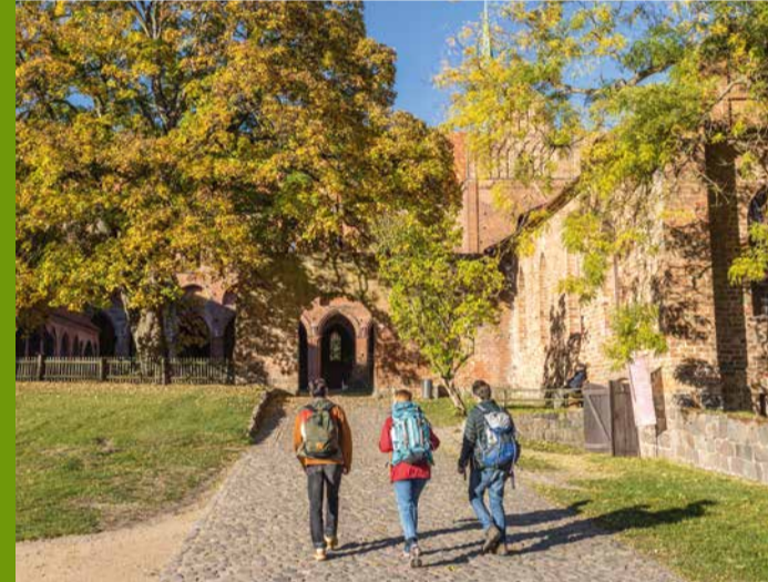
Einen Besuch wert: das Kloster Chorin

Etappe 5 startet mit dem schönen Pfad am Amtssee und gleich zu Beginn mit einem Highlight: Das Kloster Chorin gilt als das bedeutendste Bauwerk in frühgotischer Backsteinbauweise in der Mark Brandenburg. Durch ein Waldstück gelangt man anschließend nach Brodowin, wo das weit über seine Grenzen bekannte Ökodorf Brodowin mit Hofladen und Biergarten aufwartet. Regelmäßige Hofführungen runden die Angebotspalette ab. Durch die charmante Brodowiner Dorfstraße mit sehenswerter Feldsteinkirche geht es wieder in die mittlerweile sanft hügelige Landschaft und durch ein Waldstück auf einen kleinen Höhenzug vor Oderberg, bevor man bis auf Wasserhöhe des Oder-Havel-Kanals im Herzen Oderbergs ankommt.