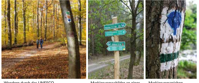
Wandern durch das UNESCO Weltnaturerbe Buchenwald Grumsin | Markierungsschilder an einer Weggabelung | Markierungszeichen wegbegleitend

Die faszinierende Landschaft der Schorfheide können Wanderer auf dem 135 km langen Weg "Rund um die Schorfheide" in 7 Etappen durchstreifen.